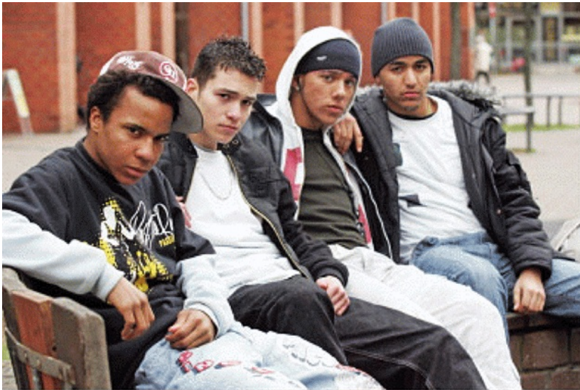
Berlin Kreuzberg Wolfgang Krolow Galerie argus